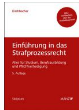
Einführung in das Strafprozessrecht Ladenpreis: 30,20EUR