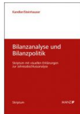
Bilanzanalyse und Bilanzpolitik