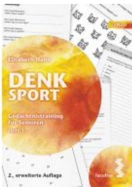
Denksport Ladenpreis: 14,90EUR