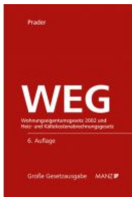
WEG - Wohnungseigentumsgesetz 2002 und HeizKG