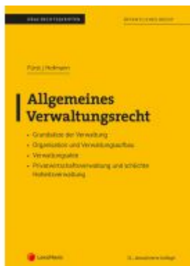
Allgemeines Verwaltungsrecht (Skriptum)