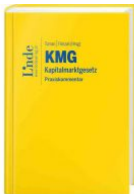
KMG | Kapitalmarktgesetz Ladenpreis: 89,00EUR