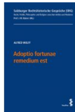
Adoptio fortunae remedium est Ladenpreis: 63,00EUR