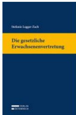
Die gesetzliche Erwachsenenvertretung Ladenpreis: 79,00EUR