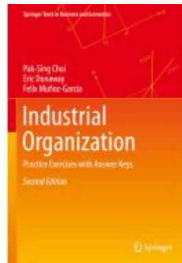
Industrial Organization Ladenpreis: 142,99EUR