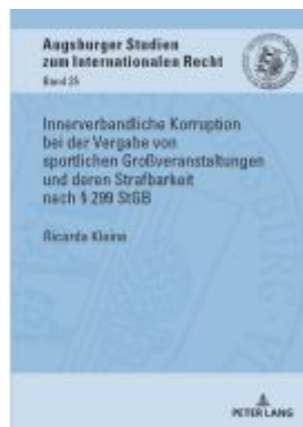
Innerverbandliche Korruption bei der Vergabe von sportlichen Großveranstaltungen und deren Strafbarkeit nach § 299 StGB Ladenpreis: 56,50EUR