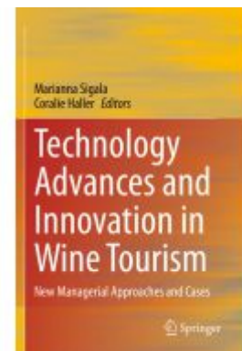
Technology Advances and Innovation in Wine Tourism Ladenpreis: 186,99EUR