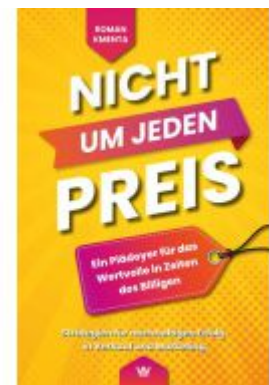
Nicht um jeden Preis Ladenpreis: 19,97EUR