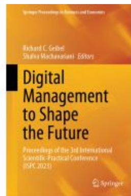
Digital Management to Shape the Future Ladenpreis: 175,99EUR