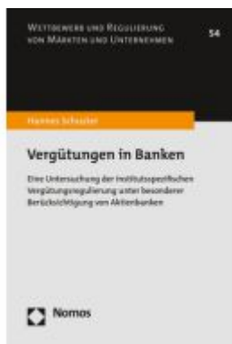
Vergütungen in Banken Ladenpreis: 132,70EUR