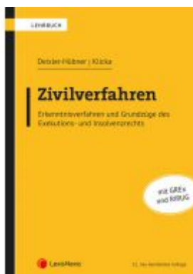
Zivilverfahren Ladenpreis: 66,00 EUR