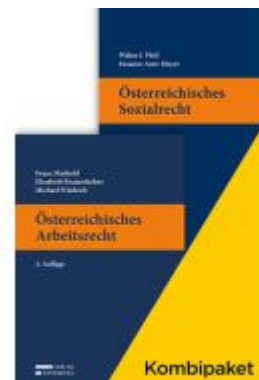
Kombipaket Österreichisches Arbeits- und Sozialrecht Ladenpreis: 104,00 EUR