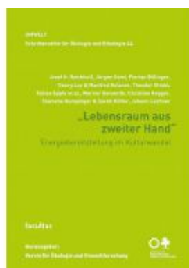
Lebensraum aus zweiter Hand Ladenpreis: 17,90 EUR