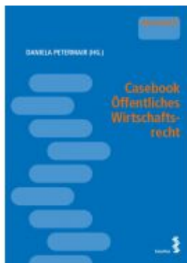
Casebook Öffentliches Wirtschaftsrecht Ladenpreis: 24,00 EUR