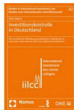
Investitionskontrolle in Deutschland Ladenpreis: 188,10 EUR