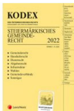
KODEX Steiermärkisches Gemeindericht 2022 - inkl. App Ladenpreis: 87,00 EUR