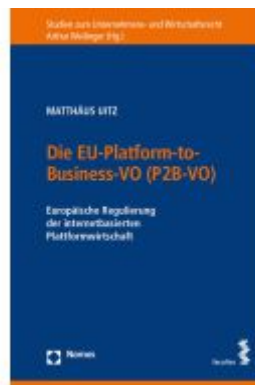
Die EU-Plattform-to-Business-VO (P2B-VO) Ladenpreis: 68,00EUR