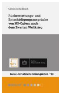
Rückerstattungs- und Entschädigungsansprüche von NS-Opfern nach dem Zweiten Weltkrieg