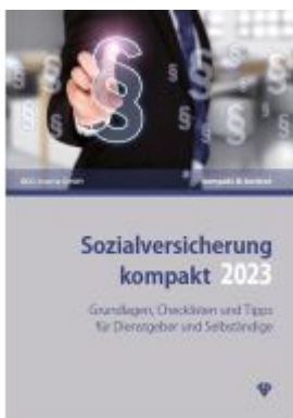
Sozialversicherung kompakt 2023