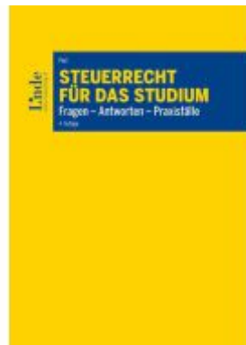
Steuerrecht für das Studium Ladenpreis: 45,00EUR