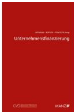
Unternehmensfinanzierung Ladenpreis: 44,00EUR