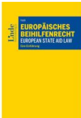
Europäisches Beihilfenrecht | European State Aid Law Ladenpreis: 49,00EUR

Wir haben andere Produkte gefunden, die Ihnen gefallen könnten!