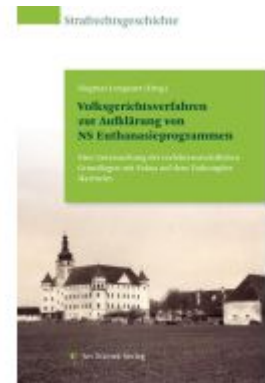
Vollgerichtsverfahren zur Aufklärung von NS Euthanasieprogrammen Ladenpreis: 59,90EUR