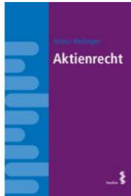
Aktienrecht Ladenpreis: 12,00EUR