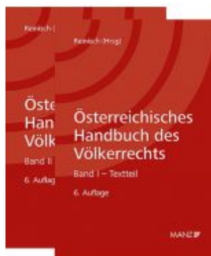
Österreichisches Handbuch des Völkerrechts Ladenpreis: 124,00EUR