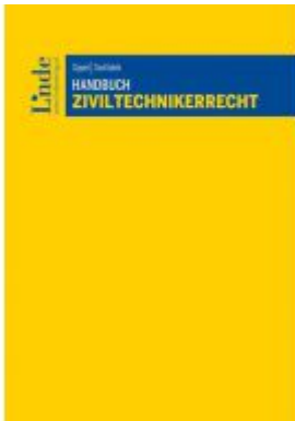
Handbuch Ziviltechnikerrecht Ladenpreis: 99,00EUR