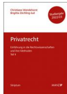
Privatrecht Einführung in die Rechtswissenschaften und ihre Methoden: Teil II Ladenpreis: 14,70EUR