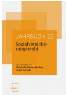
Sozialversicherungsrecht Ladenpreis: 68,00EUR