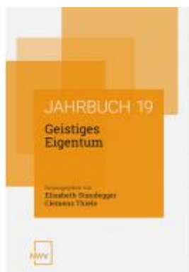
Geistiges Eigentum Ladenpreis: 68,00EUR