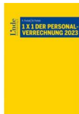
1 x 1 der Personalverrechnung 2023 Ladenpreis: 39,00EUR