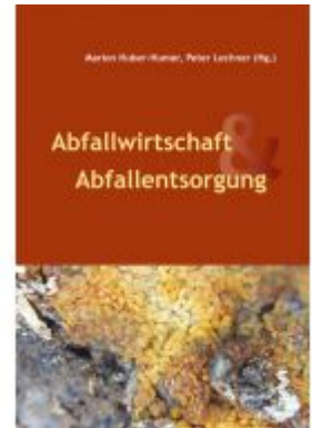
Abfallwirtschaft & Abfallentsorgung Ladenpreis: 32,00EUR