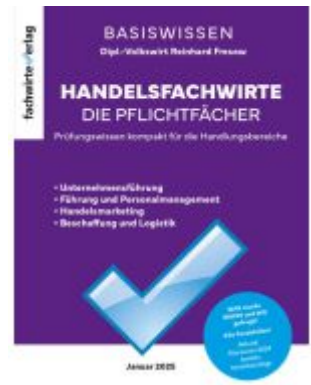
Handelsfachwirte - Die Zusammenfassung Ladenpreis: 28,80EUR