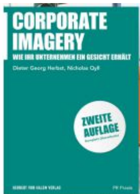
Corporate Imagery Ladenpreis: 35,00EUR

Wir haben andere Produkte gefunden, die Ihnen gefallen könnten!