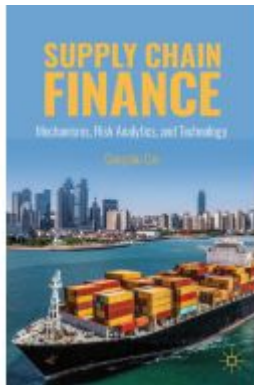
Supply Chain Finance Ladenpreis: 109,99EUR