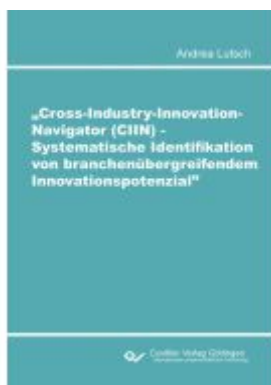
Cross-Industry-Innovation-Navigator (CIIN) - Systematische Identifikation von branchenübergreifendem Innovationspotenzial Ladenpreis: 91,80EUR