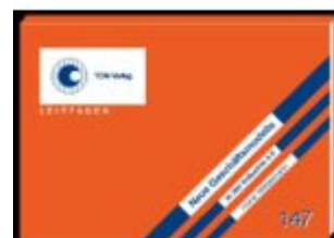
Neue Geschäftsmodelle in der Industrie 4.0 Ladenpreis: 257,10EUR