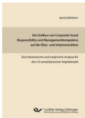
Der Einfluss von Corporate Social Responsibility und Managementkompetenz auf die Über- und Unterinvestition Ladenpreis: 86,20EUR