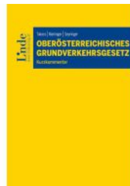
Oberösterreichisches Grundverkehrsgesetz Ladenpreis: 55,00EUR