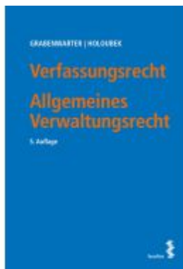
Verfassungsrecht. Allgemeines Verwaltungsrecht Ladenpreis: 46,00EUR

Wir haben andere Produkte gefunden, die Ihnen gefallen könnten!