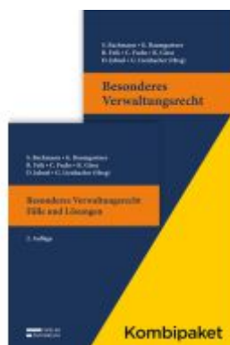
Kombipaket Besonderes Verwaltungsrecht: Lehrbuch & Fälle und Lösungen Ladenpreis: 78,00EUR