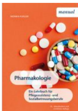
Pharmakologie Ladenpreis: 24,90EUR