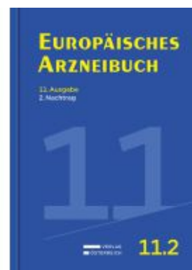
Europäisches Arzneibuch Ladenpreis: 38,35EUR