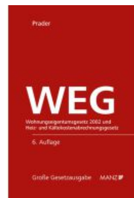
WEG - Wohnungseigentumsgesetz 2002 und HeizKG Ladenpreis: 208,00EUR