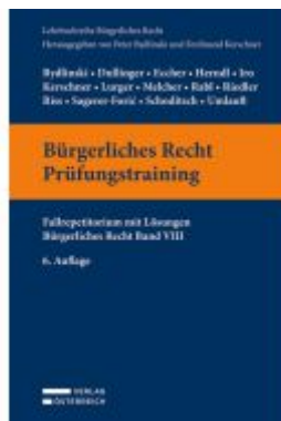
Bürgerliches Recht Prüfungstraining Ladenpreis: 39,00EUR