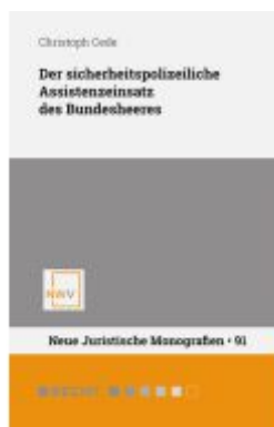
Der sicherheitspolizeiliche Assistenzeinsatz des Bundesheeres Ladenpreis: 68,00EUR