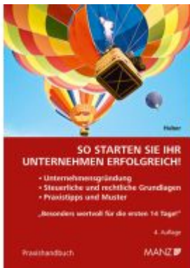
So starten Sie Ihr Unternehmen erfolgreich! Ladenpreis: 34,00EUR

Wir haben andere Produkte gefunden, die Ihnen gefallen könnten!