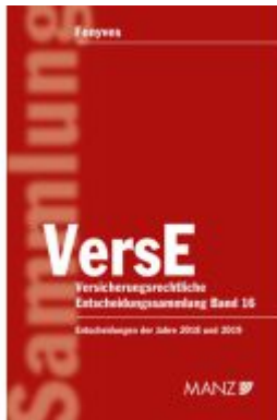
Versicherungsrechtliche Entscheidungssammlung VersE Ladenpreis: 259,00EUR