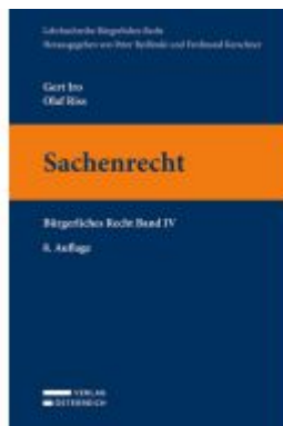
Sachenrecht Ladenpreis: 37,00EUR