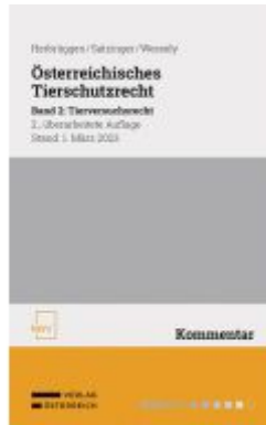
Österreichisches Tierschutzrecht Ladenpreis: 88,00EUR