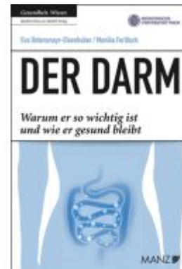
Der Darm Ladenpreis: 23,90EUR