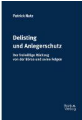
Delisting und Anlegerschutz Ladenpreis: 79,00EUR