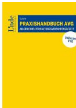
Praxishandbuch AVG | Allgemeines Verwaltungsverfahrensgesetz Ladenpreis: 49,00EUR