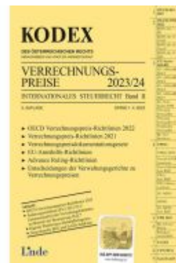
KODEX Verrechnungspreise 2023/24 Ladenpreis: 63,00EUR