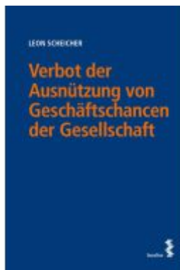
Verbot der Ausnützung von Geschäftschancen der Gesellschaft Ladenpreis: 58,00EUR