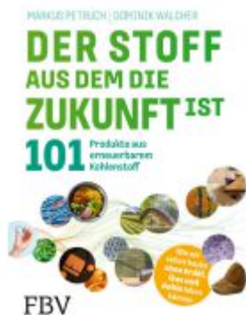
Der Stoff, aus dem die Zukunft ist Ladenpreis: 25,80EUR

Wir haben andere Produkte gefunden, die Ihnen gefallen könnten!