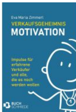
Verkaufsgeheimnis Motivation Ladenpreis: 14,90EUR