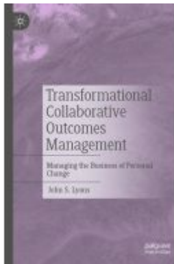
Transformational Collaborative Outcomes Management Ladenpreis: 109,99EUR