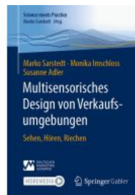
Multisensorisches Design von Verkaufsumgebungen Ladenpreis: 33,91EUR