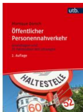
Öffentlicher Personennahverkehr Ladenpreis: 39,00EUR