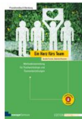
Ein Herz fürs Team Ladenpreis: 51,30EUR