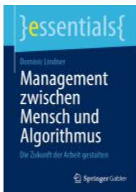
Management zwischen Mensch und Algorithmus Ladenpreis: 15,41EUR