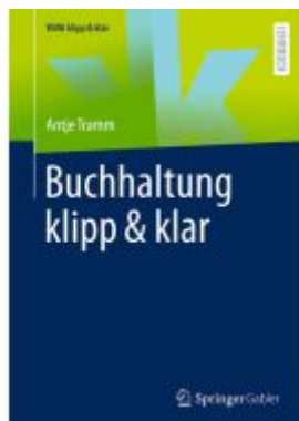
Buchhaltung klipp & klar Ladenpreis: 25,64EUR