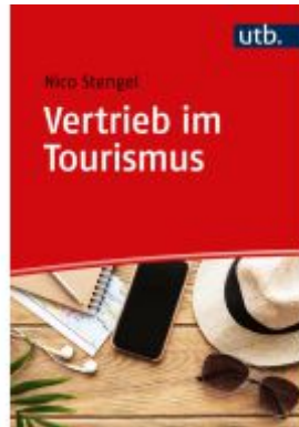
Vertrieb im Tourismus Ladenpreis: 25,60EUR