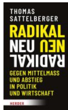
Radikal neu Ladenpreis: 25,80EUR