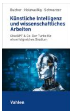
Künstliche Intelligenz und wissenschaftliches Arbeiten Ladenpreis: 17,40EUR