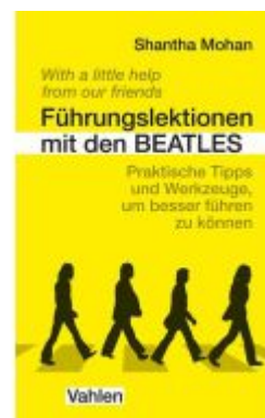
Führungslektionen mit den Beatles Ladenpreis: 25,60EUR