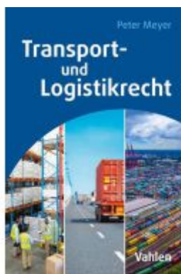
Transport- und Logistikrecht Ladenpreis: 30,70EUR