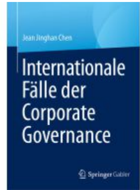
Internationale Fälle der Corporate Governance Ladenpreis: 51,39EUR