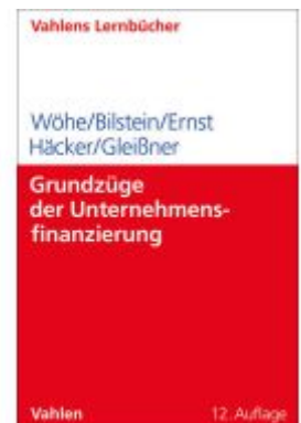
Grundzüge der Unternehmensfinanzierung Ladenpreis: 35,90EUR