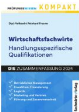
Wirtschaftsfachwirte: Handlungsspezifische Qualifikationen Ladenpreis: 28,80EUR