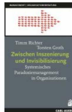
Zwischen Inszenierung und Invisibilisierung Ladenpreis: 30,80EUR