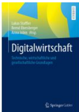
Digitalwirtschaft Ladenpreis: 41,11EUR

Wir haben andere Produkte gefunden, die Ihnen gefallen könnten!