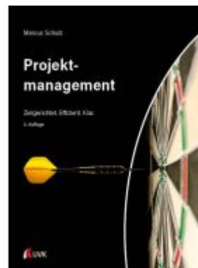
Projektmanagement Ladenpreis: 46,40EUR