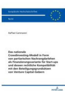
Das nationale Crowdfunding-Modell in Form von partiarischen Nachrangdarlehen als Finanzierungsvariante für Startups und dessen rechtliche Kompatibilität mit den Beteiligungsgrundsätzen von Venture Capital-Gebern Ladenpreis: 92,50EUR