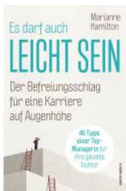
Es darf auch leicht sein Ladenpreis: 20,60EUR