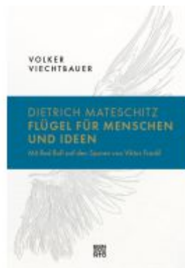
Dietrich Mateschitz: Flügel für Menschen und Ideen Ladenpreis: 26,00EUR