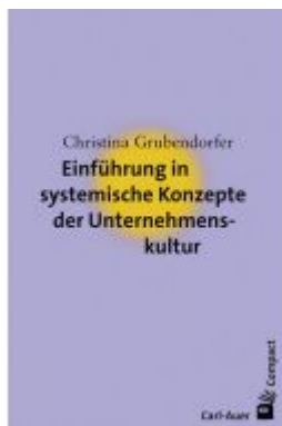
Einführung in systemische Konzepte der Unternehmenskultur Ladenpreis: 17,50EUR