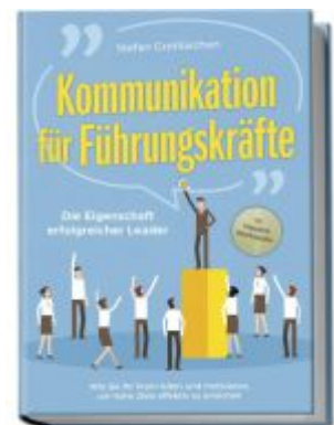
Kommunikation für Führungskräfte - Die Eigenschaft erfolgreicher Leader: Wie Sie Ihr Team leiten und motivieren, um hohe Ziele effektiv zu erreichen - inkl. Erfolgsguide für Mitarbeitergespräche Ladenpreis: 15,90EUR