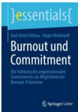
Burnout und Commitment Ladenpreis: 15,41EUR