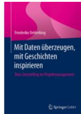
Mit Daten überzeugen, mit Geschichten inspirieren Ladenpreis: 41,11EUR