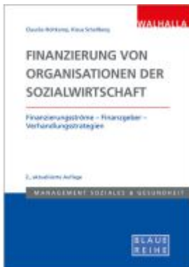
Finanzierung von Organisationen der Sozialwirtschaft Ladenpreis: 36,00EUR