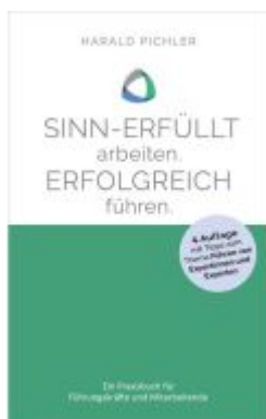
Sinn-erfüllt arbeiten. Erfolgreich führen. Ladenpreis: 14,40EUR