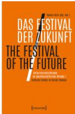
Das Festival der Zukunft / The Festival of the Future Ladenpreis: 29,00EUR

Wir haben andere Produkte gefunden, die Ihnen gefallen könnten!