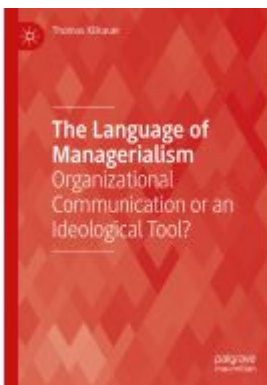
The Language of Managerialism Ladenpreis: 164,99EUR