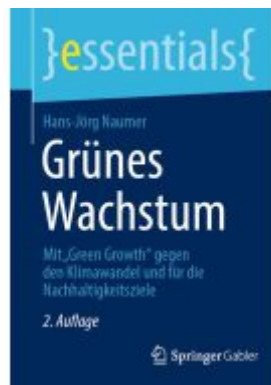
Grünes Wachstum Ladenpreis: 15,41EUR