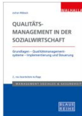
Qualitätsmanagement in der Sozialwirtschaft Ladenpreis: 36,00EUR

Into the Unknown Effective leadership in transformations