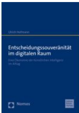
Entscheidungssouveränität im digitalen Raum Ladenpreis: 35,00EUR