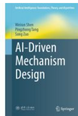
AI-Driven Mechanism Design Ladenpreis: 197,99EUR