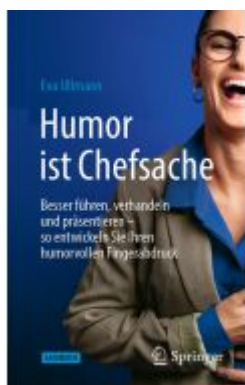
Humor ist Chefsache Ladenpreis: 30,83EUR