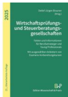
Wirtschaftsprüfungs- und Steuerberatungsgesellschaften 2025 Ladenpreis: 25,60EUR