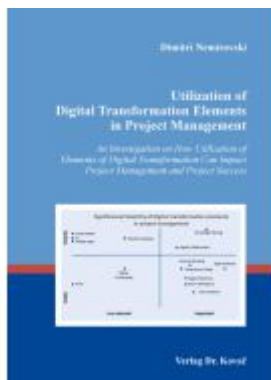
Utilization of Digital Transformation Elements in Project Management Ladenpreis: 102,60EUR