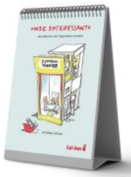
"Wie interessant" – Den Wahnsinn der Organisation verstehen mit Niklas Luhmann Ladenpreis: 29,90EUR