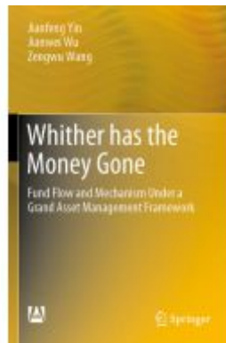
Whither has the Money Gone Ladenpreis: 131,99EUR