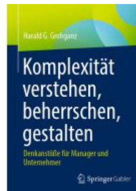
Komplexität verstehen, beherrschen, gestalten Ladenpreis: 41,11EUR