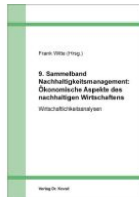
9. Sammelband Nachhaltigkeitsmanagement: Ökonomische Aspekte des nachhaltigen Wirtschaftens Ladenpreis: 76,90EUR