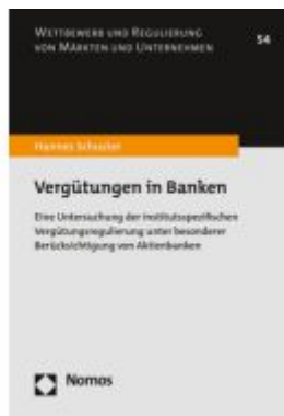
Vergütungen in Banken Ladenpreis: 132,70EUR