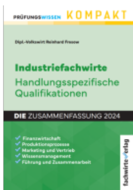
Industriefachwirte: Die Zusammenfassung Ladenpreis: 25,50EUR