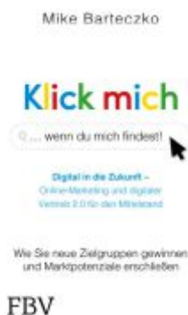
Klick mich, wenn du mich findest Ladenpreis: 20,60EUR