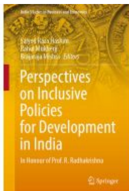
Perspectives on Inclusive Policies for Development in India Ladenpreis: 175,99EUR

Wir haben andere Produkte gefunden, die Ihnen gefallen könnten!