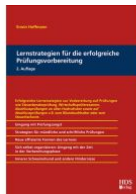
Lernstrategien für die erfolgreiche Prüfungsvorbereitung Ladenpreis: 56,50EUR