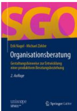
Organisationsberatung Ladenpreis: 66,81EUR