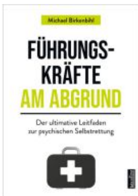
Führungskräfte am Abgrund Ladenpreis: 23,70EUR

Wir haben andere Produkte gefunden, die Ihnen gefallen könnten!