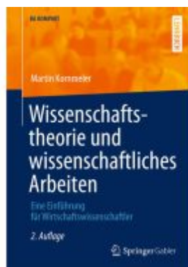
Wissenschaftstheorie und wissenschaftliches Arbeiten Ladenpreis: 20,51EUR