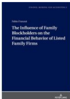
The Influence of Family Blockholders on the Financial Behavior of Listed Family Firms Ladenpreis: 46,20EUR