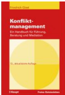
Konfliktmanagement Ladenpreis: 94,60EUR