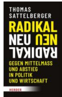
Radikal neu Ladenpreis: 25,80EUR