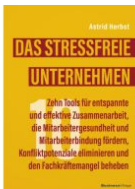
Das stressfreie Unternehmen Ladenpreis: 27,80EUR