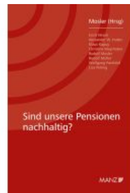
Sind unsere Pensionen nachhaltig? Ladenpreis: 28,00EUR