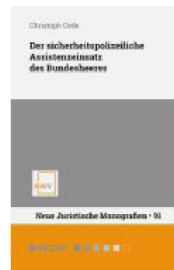
Der sicherheitspolizeiliche Assistenzeinsatz des Bundesheeres Ladenpreis: 68,00EUR