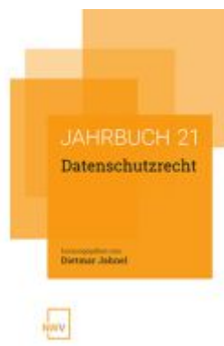
Datenschutzrecht Ladenpreis: 58,00EUR