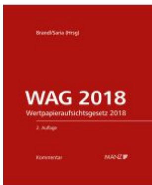
WAG 2018 2.Auflage Ladenpreis: 348,00EUR