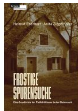
Frostige Spurensuche – Eine Geschichte der Tiefkühlhäuser in der Steiermark Ladenpreis: 30,50EUR