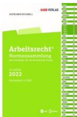
Arbeitsrecht+ Ladenpreis: 59,00EUR