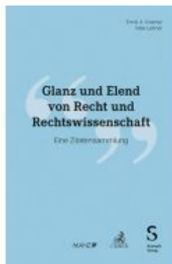
Glanz und Elend von Recht und Rechtswissenschaft Ladenpreis: 40,00EUR