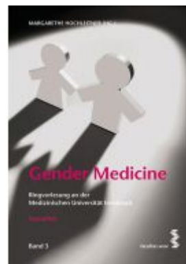
Gender Medicine Ladenpreis: 22,90 EUR