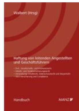
Haftung von leitenden Angestellten und Geschäftsführern Ladenpreis: 98,00 EUR