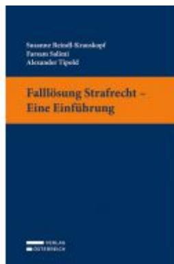
Falllösung Strafrecht - Eine Einführung Ladenpreis: 32,00 EUR