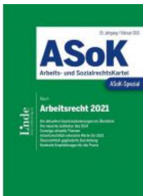
ASoK-Spezial Arbeitsrecht 2021 Ladenpreis: 29,00 EUR