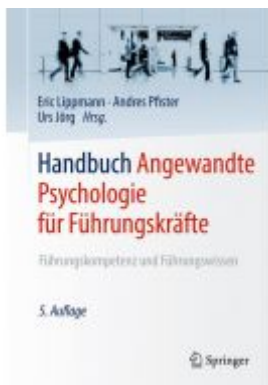
Handbuch Angewandte Psychologie für Führungskräfte Ladenpreis: 133,63 EUR