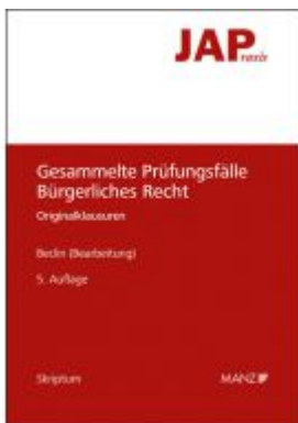
JAP - Gesammelte Prüfungsfälle Bürgerliches Recht Ladenpreis: 36,00 EUR