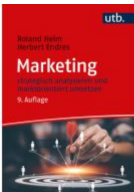
Marketing Ladenpreis: 35,90EUR

Wir haben andere Produkte gefunden, die Ihnen gefallen könnten!