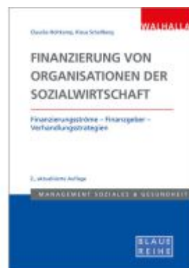
Finanzierung von Organisationen der Sozialwirtschaft Ladenpreis: 36,00EUR