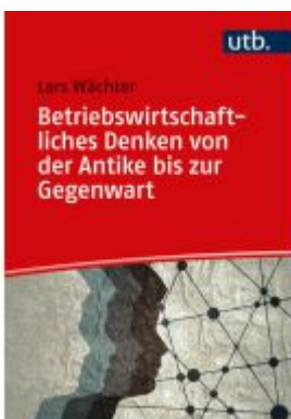
Betriebswirtschaftliches Denken von der Antike bis zur Gegenwart Ladenpreis: 30,80EUR