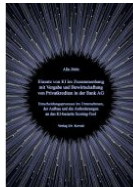
Einsatz von KI im Zusammenhang mit Vergabe und Bewirtschaftung von Privatkrediten in der Bank AG Ladenpreis: 76,90EUR