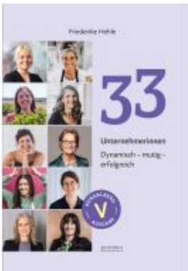
33 Unternehmerinnen Ladenpreis: 14,95EUR