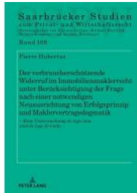
Der verbraucher-schützende Widerruf im Immobilienmaklerrecht unter Berücksichtigung der Frage nach einer notwendigen Neuausrichtung von Erfolgsprinzip und Maklervertragsdogmatik Ladenpreis: 56,50EUR