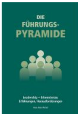
Die Führungspyramide Ladenpreis: 19,90EUR