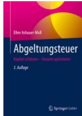
Abgeltungsteuer Ladenpreis: 56,53EUR