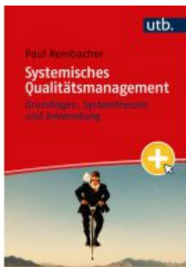
Systemisches Qualitätsmanagement Ladenpreis: 25,60EUR