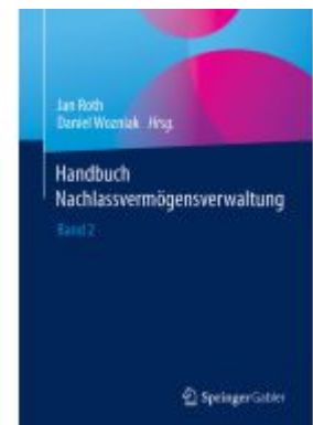
Handbuch Nachlassvermögensverwaltung Ladenpreis: 56,53EUR