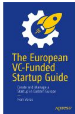
The European VC-Funded Startup Guide Ladenpreis: 41,79EUR