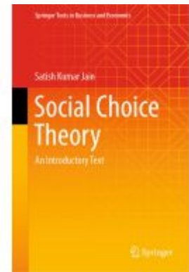
Social Choice Theory Ladenpreis: 98,99EUR