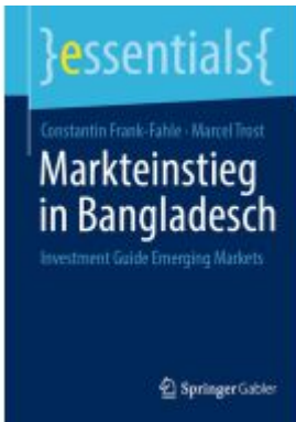
Markteinstieg in Bangladesch Ladenpreis: 15,41EUR