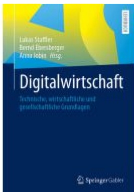
Digitalwirtschaft Ladenpreis: 41,11EUR