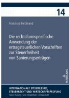
Die rechtsformspezifische Anwendung der ertragsteuerlichen Vorschriften zur Steuerfreiheit von Sanierungserträgen Ladenpreis: 102,80EUR