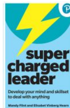
Supercharged Leader: Develop your mind and skillset to deal with anything Ladenpreis: 14,97EUR