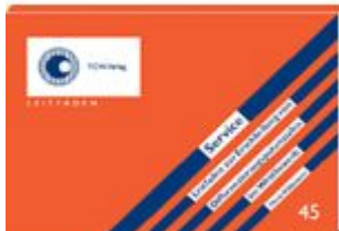
Service Ladenpreis: 233,64EUR