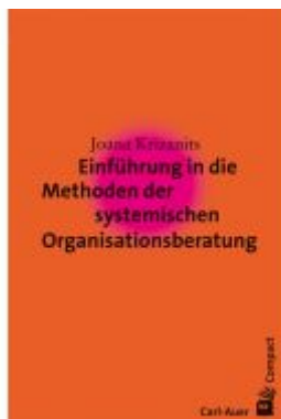
Einführung in die Methoden der systemischen Organisationsberatung Ladenpreis: 17,50EUR