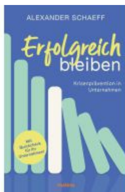
Erfolgreich bleiben Ladenpreis: 22,70EUR