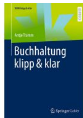
Buchhaltung klipp & klar Ladenpreis: 25,64EUR