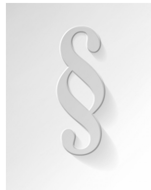
Gut schlafen, besser arbeiten: Schlaf als Erfolgsfaktor von Unternehmen Ladenpreis: 13,46EUR