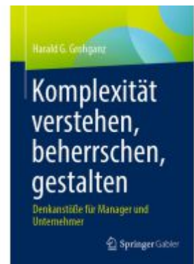
Komplexität verstehen, beherrschen, gestalten Ladenpreis: 41,11EUR