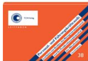
Personal- und Führungskräfteaudit Ladenpreis: 257,10EUR