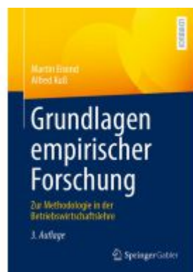
Grundlagen empirischer Forschung Ladenpreis: 39,06EUR