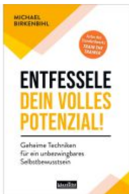
Entfessele dein volles Potenzial! Ladenpreis: 20,60EUR