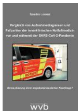
Vergleich von Aufnahmediagnosen und Fallzahlen der innerklinischen Notfallmedizin vor und während der SARS- CoV-2-Pandemie Ladenpreis: 24,70EUR