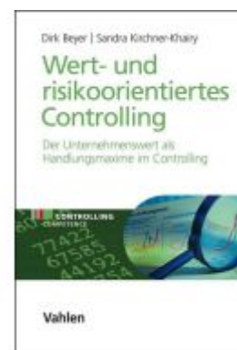
Wert- und risikoorientiertes Controlling Ladenpreis: 46,20EUR