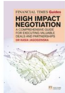
The Financial Times Guide to High Impact Negotiation: A comprehensive guide for executing valuable deals and partnerships Ladenpreis: 34,23EUR