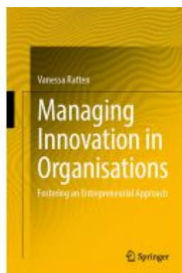
Managing Innovation in Organisations Ladenpreis: 98,99EUR