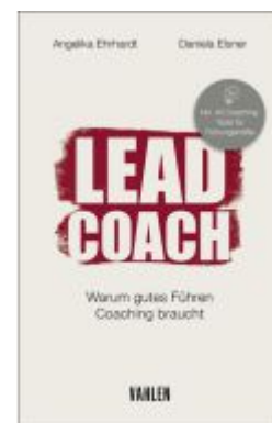
LEAD COACH Ladenpreis: 25,60EUR