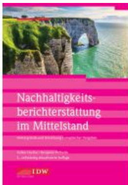
Nachhaltigkeitsberichterstattung im Mittelstand Ladenpreis: 50,40EUR

Wir haben andere Produkte gefunden, die Ihnen gefallen könnten!