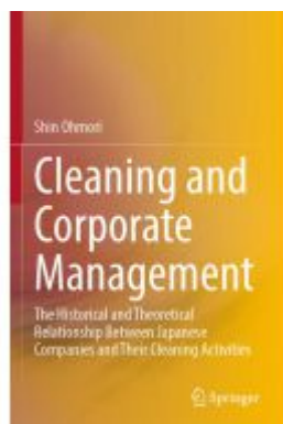
Cleaning and Corporate Management Ladenpreis: 131,99EUR