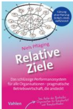
Relative Ziele Ladenpreis: 17,40EUR