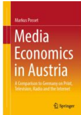
Media Economics in Austria Ladenpreis: 65,99EUR