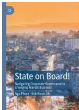
State on Board! Ladenpreis: 131,99EUR