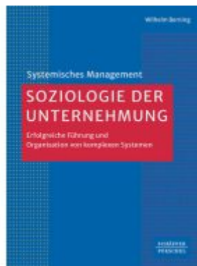
Soziologie der Unternehmung Ladenpreis: 61,70EUR