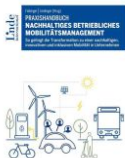
Praxishandbuch Nachhaltiges betriebliches Mobilitätsmanagement Ladenpreis: 62,00EUR