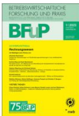
Rechnungswesen Ladenpreis: 40,30EUR