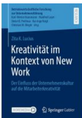
Kreativität im Kontext von New Work Ladenpreis: 71,95EUR