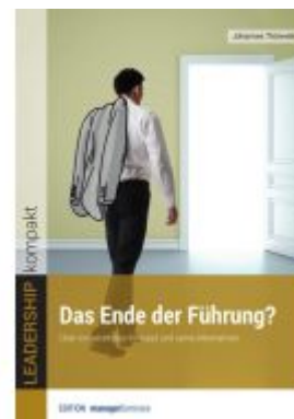
Das Ende der Führung? Ladenpreis: 30,80EUR