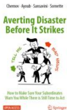
Averting Disaster Before It Strikes Ladenpreis: 54,99EUR