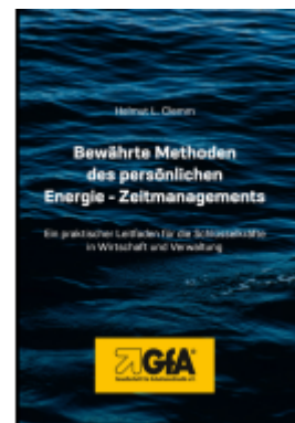
Bewährte Methoden des persönlichen Energie Zeitmanagement Ladenpreis: 46,10EUR