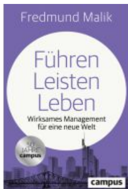
Führen Leisten Leben Ladenpreis: 25,70EUR

Wir haben andere Produkte gefunden, die Ihnen gefallen könnten!