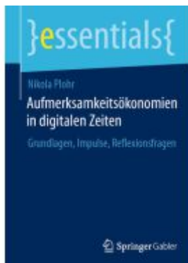
Aufmerksamkeitsökonomien in digitalen Zeiten Ladenpreis: 15,41EUR