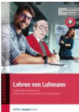
Lehren von Luhmann Ladenpreis: 30,80EUR

Wir haben andere Produkte gefunden, die Ihnen gefallen könnten!