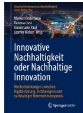
Innovative Nachhaltigkeit oder Nachhaltige Innovation Ladenpreis: 61,67EUR