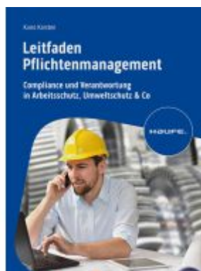
Leitfaden Pflichtenmanagement Ladenpreis: 72,00EUR