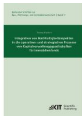
Integration von Nachhaltigkeitsaspekten in die operativen und strategischen Prozesse von Kapitalverwaltungsgesellschaften für Immobilienfonds Ladenpreis: 55,60EUR