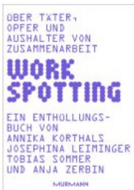
WORKSPOTTING Ladenpreis: 35,00EUR