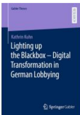
Lighting up the Blackbox — Digital Transformation in German Lobbying Ladenpreis: 98,99EUR