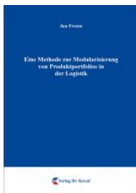
Eine Methode zur Modularisierung von Produktportfolios in der Logistik Ladenpreis: 90,30EUR