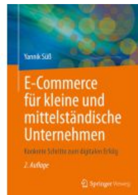
E-Commerce für kleine und mittelständische Unternehmen Ladenpreis: 35,97EUR