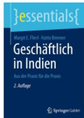
Geschäftlich in Indien Ladenpreis: 15,41EUR