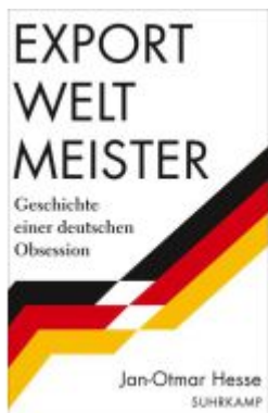
Exportweltmeister Ladenpreis: 28,80EUR

Wir haben andere Produkte gefunden, die Ihnen gefallen könnten!