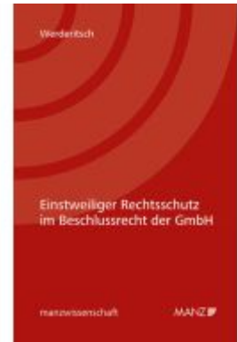
Einstweiliger Rechtsschutz im Beschlussrecht der GmbH Ladenpreis: 48,00EUR