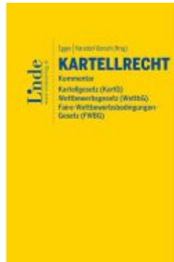
Kartellrecht Kommentar Ladenpreis: 290,00EUR