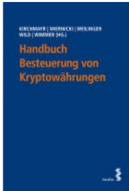
Handbuch Besteuerung von Kryptowährungen Ladenpreis: 72,00EUR

Wir haben andere Produkte gefunden, die Ihnen gefallen könnten!