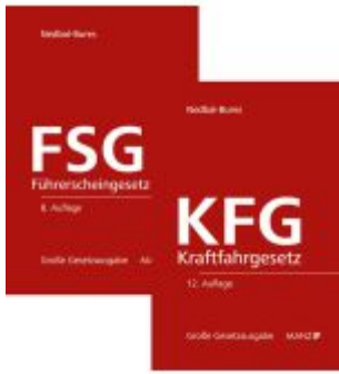
PAKET: Kraftfahrgesetz 12. Aufl + Führerscheingesetz 8. Aufl Ladenpreis: 220,00EUR