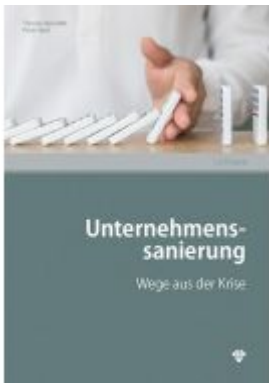
Unternehmenssanierung Ladenpreis: 31,90EUR