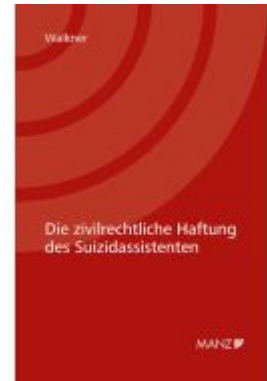
Die zivilrechtliche Haftung des Suizidassistenten Ladenpreis: 38,00EUR