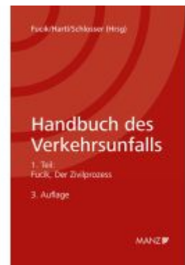
Handbuch des Verkehrsunfalls Zivilprozessrecht Ladenpreis: 54,00EUR