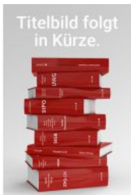
Privatversicherungsrecht Ladenpreis: 79,00EUR