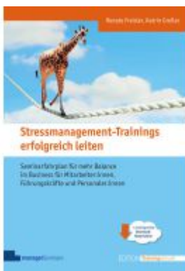
Stressmanagement-Trainings erfolgreich leiten Ladenpreis: 51,30EUR