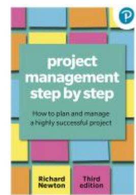
Project Management Step By Step Ladenpreis: 21,39EUR