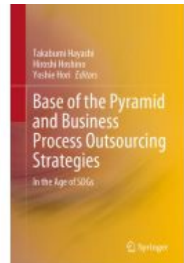
Base of the Pyramid and Business Process Outsourcing Strategies Ladenpreis: 175,99EUR