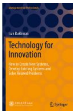
Technology for Innovation Ladenpreis: 93,49EUR