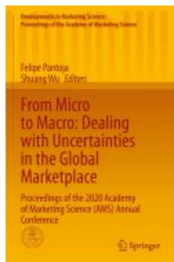
From Micro to Macro: Dealing with Uncertainties in the Global Marketplace Ladenpreis: 241,99EUR