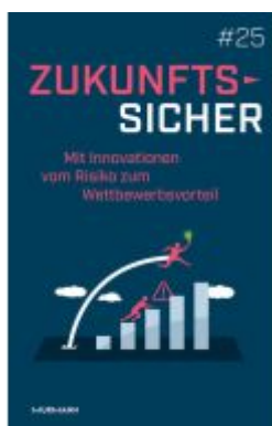
Zukunftssicher #25 Ladenpreis: 40,10EUR