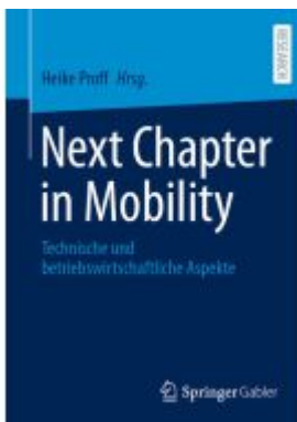
Next Chapter in Mobility Ladenpreis: 143,92EUR