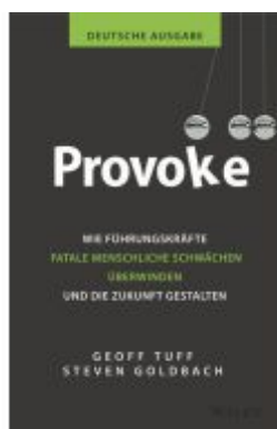
Provoke - deutsche Ausgabe Ladenpreis: 27,80EUR