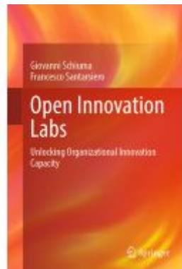
Open Innovation Labs Ladenpreis: 109,99EUR