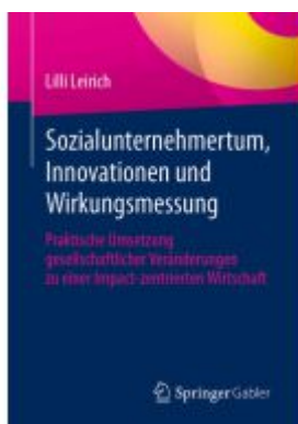
Sozialunternehmertum, Innovationen und Wirkungsmessung Ladenpreis: 39,06EUR