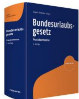
Bundesurlaubsgesetz Ladenpreis: 100,80EUR