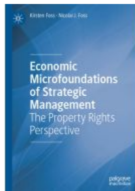
Economic Microfoundations of Strategic Management Ladenpreis: 109,99EUR