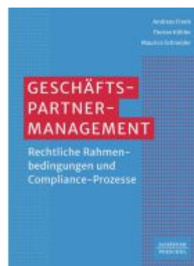
Geschäftspartner-Management Ladenpreis: 61,70EUR