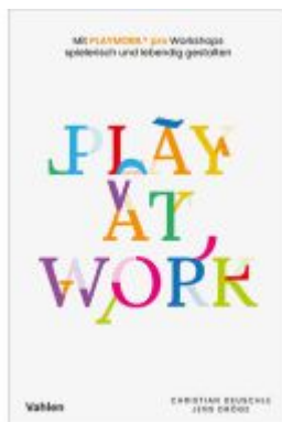
Play at Work Ladenpreis: 30,70EUR