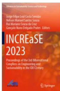
INCREaSE 2023 Ladenpreis: 241,99EUR