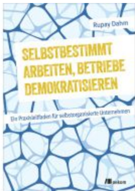
Selbstbestimmt arbeiten, Betriebe demokratisieren Ladenpreis: 43,20EUR