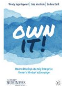
Own It! Ladenpreis: 38,49EUR