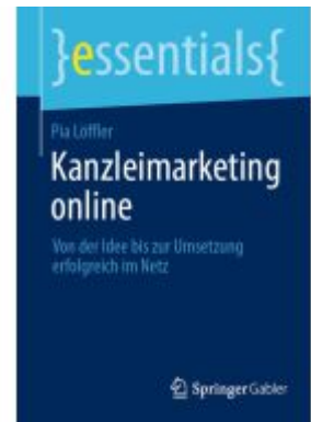
Kanzleimarketing online Ladenpreis: 15,41EUR