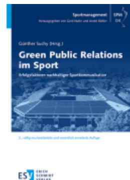
Green Public Relations im Sport Ladenpreis: 51,40EUR