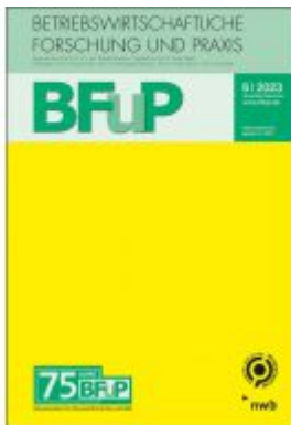
Allgemeine Betriebswirtschaftslehre – 75 Jahre BFuP Ladenpreis: 40,30EUR