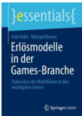
Erlösmodelle in der Games-Branche Ladenpreis: 15,41EUR