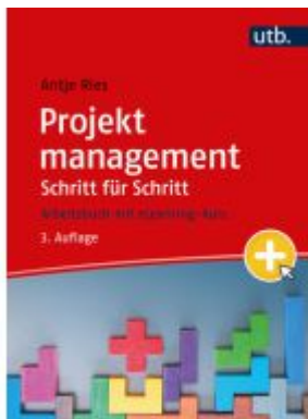
Projektmanagement Schritt für Schritt Ladenpreis: 30,80EUR