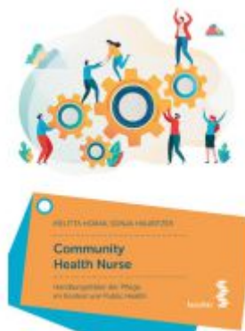
Community Health Nurse Ladenpreis: 24,90 EUR