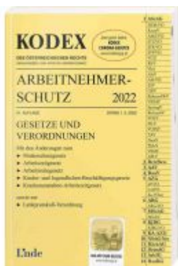
KODEX Arbeitnehmerschutz 2022 Ladenpreis: 39,00 EUR