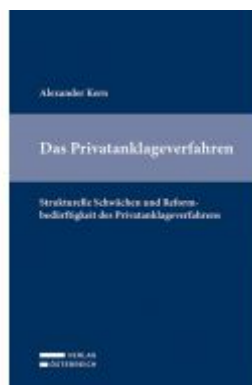
Das Privatanklageverfahren Ladenpreis: 89,00 EUR