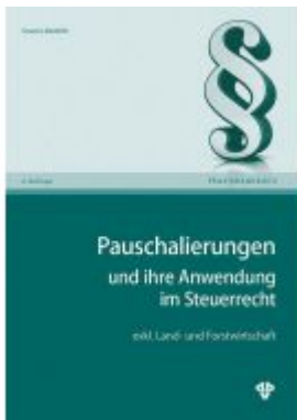
Pauschalierungen und ihre Anwendung im Steuerrecht Ladenpreis: 39,60 EUR

Wir haben andere Produkte gefunden, die Ihnen gefallen könnten!