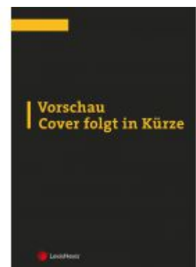
Wirtschaftsmediation Ladenpreis: 129,00 EUR