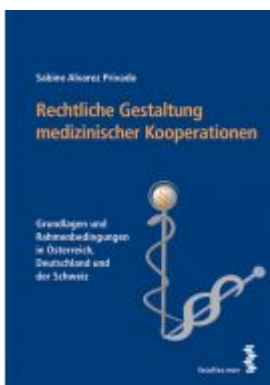
Rechtliche Gestaltung medizinischer Kooperationen Ladenpreis: 26,00 EUR