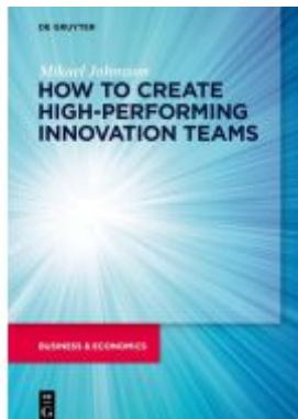
How to create high-performing innovation teams Ladenpreis: 39,95EUR