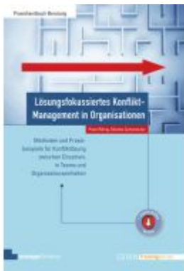
Lösungsfokussiertes Konflikt-Management in Organisationen Ladenpreis: 51,30EUR

Wir haben andere Produkte gefunden, die Ihnen gefallen könnten!