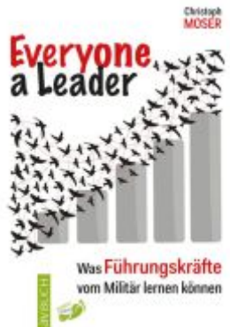
Everyone a leader Ladenpreis: 19,99EUR