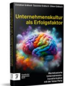
Unternehmenskultur als Erfolgsfaktor Ladenpreis: 30,70EUR