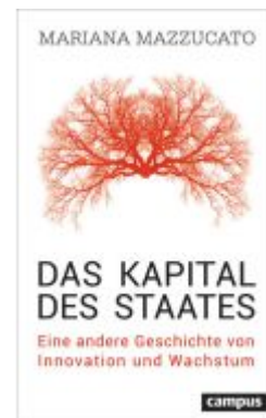
Das Kapital des Staates Ladenpreis: 18,50EUR