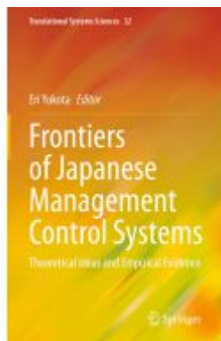
Frontiers of Japanese Management Control Systems Ladenpreis: 164,99EUR