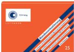
Kundenorientierung Ladenpreis: 257,10EUR