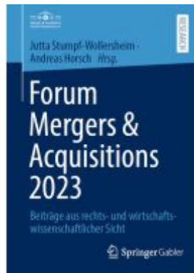
Forum Mergers & Acquisitions 2023 Ladenpreis: 92,51EUR