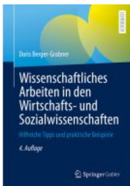
Wissenschaftliches Arbeiten in den Wirtschafts- und Sozialwissenschaften Ladenpreis: 35,97EUR