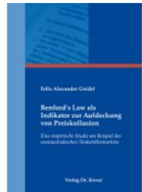
Benford's Law als Indikator zur Aufdeckung von Preiskollusion Ladenpreis: 143,80EUR