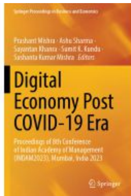
Digital Economy Post COVID-19 Era Ladenpreis: 197,99EUR

Wir haben andere Produkte gefunden, die Ihnen gefallen könnten!