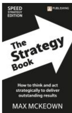
The Strategy Book: How To Think And Act Strategically To Deliver Outstanding Results Ladenpreis: 21,39EUR