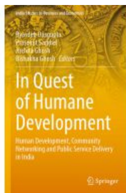
In Quest of Humane Development Ladenpreis: 164,99EUR