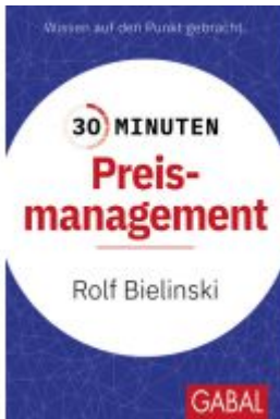
30 Minuten Preismanagement Ladenpreis: 11,30EUR