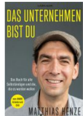
Das Unternehmen bist du. Ladenpreis: 25,70EUR