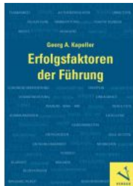
Erfolgsfaktoren der Führung Ladenpreis: 34,90EUR