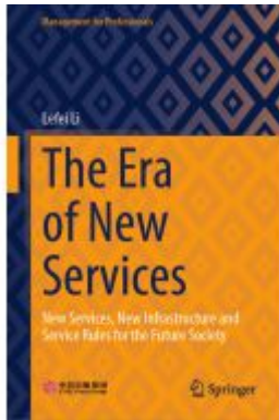
The Era of New Services Ladenpreis: 153,99EUR