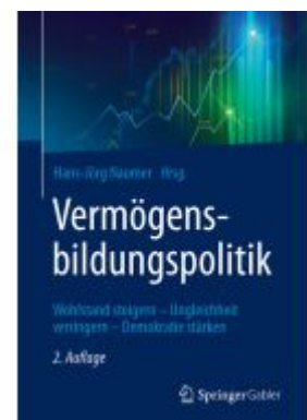
Vermögensbildungspolitik Ladenpreis: 56,53EUR