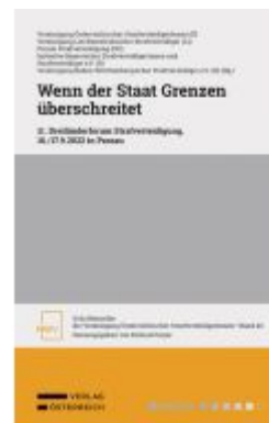
Wenn der Staat Grenzen überschreitet Ladenpreis: 68,00EUR