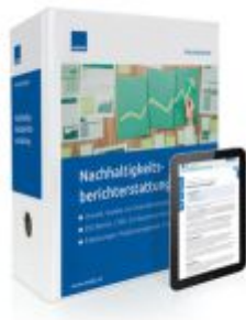
Praxishandbuch Nachhaltigkeits- Berichterstattung Ladenpreis: 272,80EUR