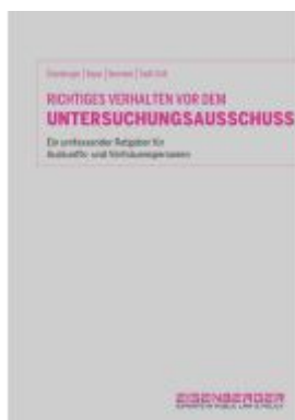
Richtiges Verhalten vor dem Untersuchungsausschuss Ladenpreis: 79,00EUR