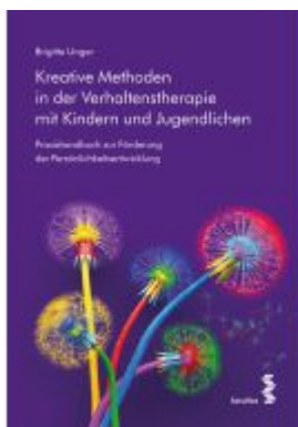
Kreative Methoden in der Verhaltenstherapie mit Kindern und Jugendlichen Ladenpreis: 23,90EUR