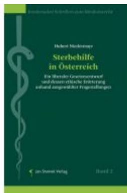
Sterbehilfe In Österreich Ladenpreis: 128,00EUR