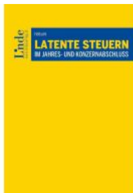
Latente Steuern im Jahres- und Konzernabschluss Ladenpreis: 66,00EUR