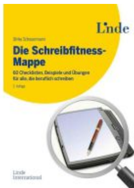
Die Schreibfitness-Mappe Ladenpreis: 22,00EUR

Wir haben andere Produkte gefunden, die Ihnen gefallen könnten!