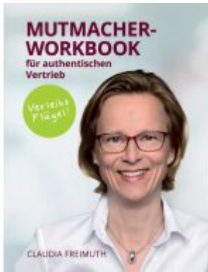
Mutmacher Workbook Ladenpreis: 24,90EUR