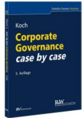
Corporate Governance case by case Ladenpreis: 29,90EUR