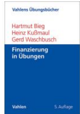
Finanzierung in Übungen Ladenpreis: 28,70EUR