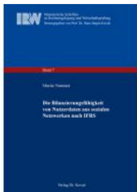
Die Bilanzierungsfähigkeit von Nutzerdaten aus sozialen Netzwerken nach IFRS Ladenpreis: 102,60EUR