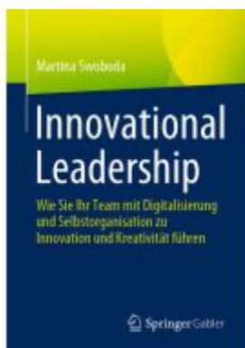
Innovational Leadership Ladenpreis: 39,05EUR