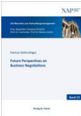
Future Perspectives on Business Negotiations Ladenpreis: 88,30EUR