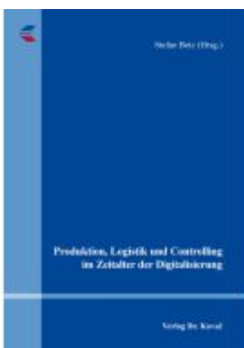
Produktion, Logistik und Controlling im Zeitalter der Digitalisierung Ladenpreis: 133,50EUR