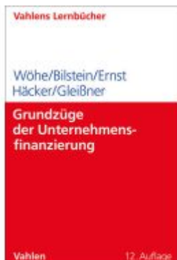
Grundzüge der Unternehmensfinanzierung Ladenpreis: 35,90EUR