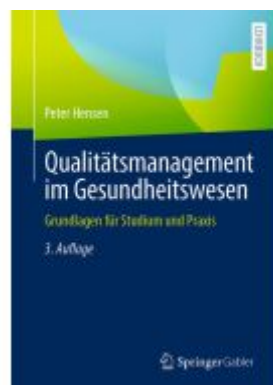
Qualitätsmanagement im Gesundheitswesen Ladenpreis: 41,11EUR