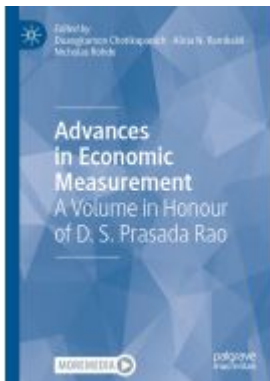
Advances in Economic Measurement Ladenpreis: 164,99EUR