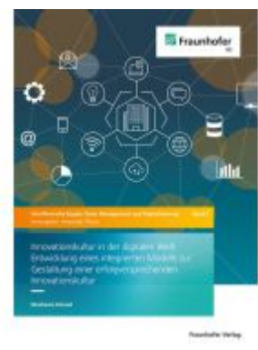
Innovationskultur in der digitalen Welt Ladenpreis: 90,50EUR