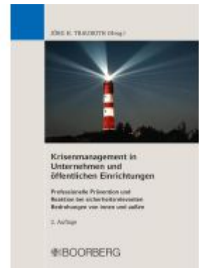
Krisenmanagement in Unternehmen und öffentlichen Einrichtungen Ladenpreis: 80,20EUR