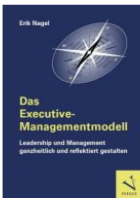
Das Executive-Managementmodell: Leadership und Management ganzheitlich und reflektiert gestalten Ladenpreis: 34,90EUR