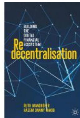
Redecentralisation Ladenpreis: 87,99EUR