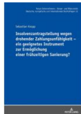
Insolvenzantragstellung wegen drohender Zahlungsunfähigkeit – ein geeignetes Instrument zur Ermöglichung einer frühzeitigen Sanierung? Ladenpreis: 111,10EUR