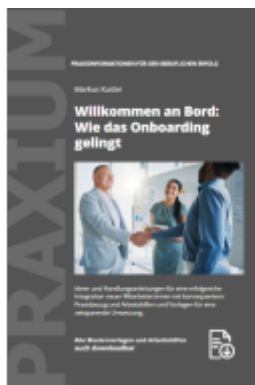
Willkommen an Bord: Wie das Onboarding gelingt Ladenpreis: 48,00EUR