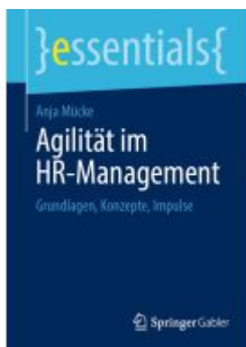
Agilität im HR-Management Ladenpreis: 15,41EUR