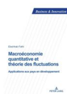
Macroéconomie quantitative et théorie des fluctuations Ladenpreis: 49,50EUR