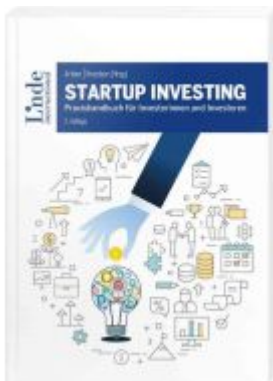
Startup Investing Ladenpreis: 44,00EUR

Wir haben andere Produkte gefunden, die Ihnen gefallen könnten!