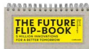
The Future Flip-Book Ladenpreis: 29,80EUR