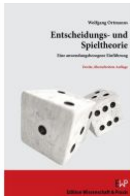
Entscheidungs- und Spieltheorie. Ladenpreis: 30,80EUR