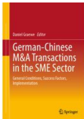
German-Chinese M&A Transactions in the SME Sector Ladenpreis: 71,49EUR