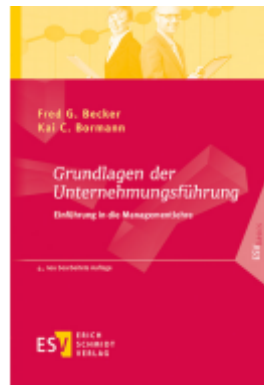
Grundlagen der Unternehmungsführung