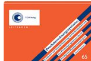
Produktordnungssysteme Ladenpreis: 257,10EUR