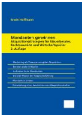
Mandanten gewinnen – Akquisitionstrategien für Steuerberater, Rechtsanwälte und Wirtschaftsprüfer Ladenpreis: 92,50EUR

Wir haben andere Produkte gefunden, die Ihnen gefallen könnten!