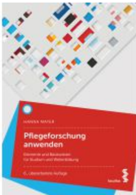
Pflegeforschung anwenden Ladenpreis: 44,90EUR