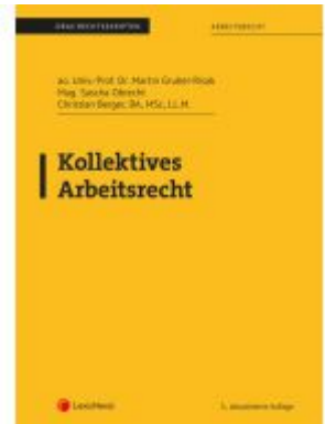
Kollektives Arbeitsrecht (Skriptum) Ladenpreis: 23,75EUR