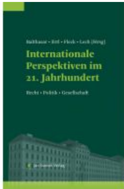
Internationale Perspektiven im 21. Jahrhundert Ladenpreis: 110,00EUR