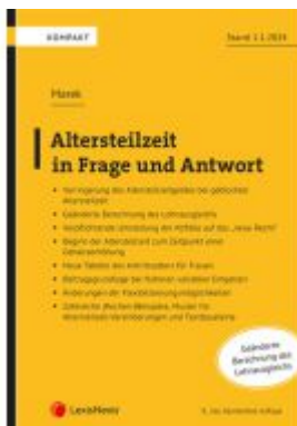
Altersteilzeit in Frage und Antwort Ladenpreis: 39,00EUR

Wir haben andere Produkte gefunden, die Ihnen gefallen könnten!