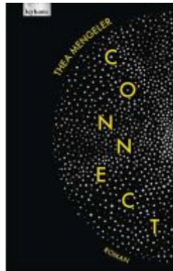
connect Ladenpreis: 24,00EUR