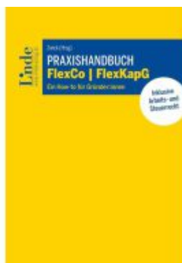
Praxishandbuch FlexCo | FlexKapG Ladenpreis: 59,00EUR