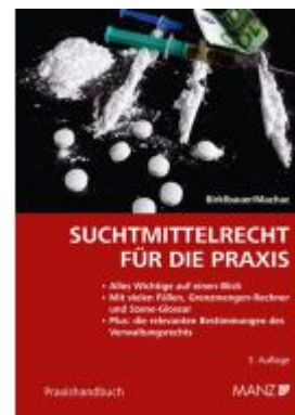
Suchtmittelrecht für die Praxis Ladenpreis: 32,00EUR