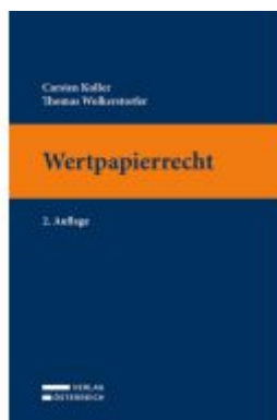
Wertpapierrecht Ladenpreis: 29,00EUR