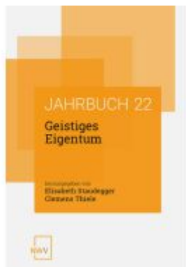
Geistiges Eigentum Ladenpreis: 72,00EUR