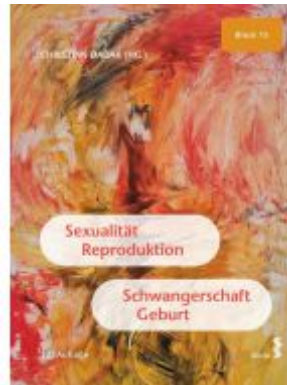
Sexualität, Reproduktion, Schwangerschaft, Geburt Ladenpreis: 29,50EUR