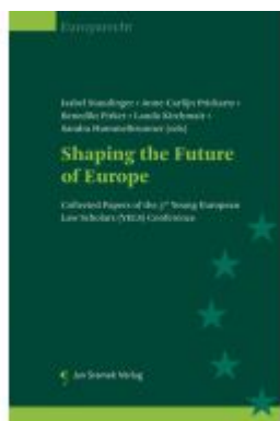
Shaping the Future of Europe Ladenpreis: 74,00EUR