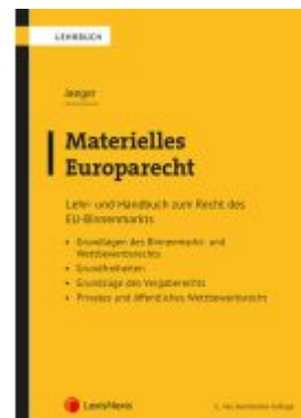
Materielles Europarecht Ladenpreis: 74,00EUR