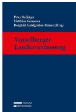
Vorarlberger Landesverfassung Ladenpreis: 259,00EUR