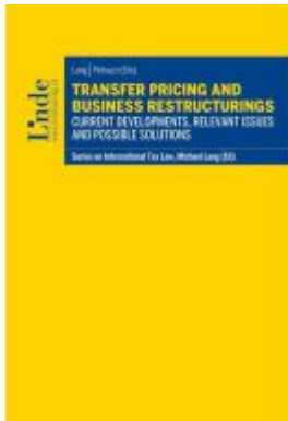
Transfer Pricing and Business Restructurings Ladenpreis: 45,00EUR