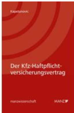
Der Kfz-Haftpflichtversicherungsvertrag Ladenpreis: 74,00EUR