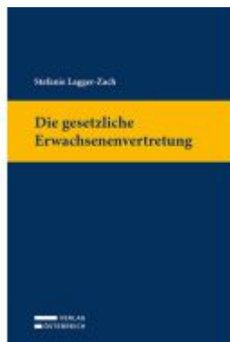
Die gesetzliche Erwachsenenvertretung Ladenpreis: 79,00EUR