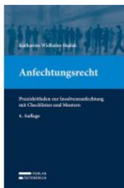
Anfechtungsrecht Ladenpreis: 49,00EUR