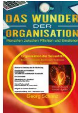
Das Wunder der Organisation - Band 5 Ladenpreis: 32,90EUR