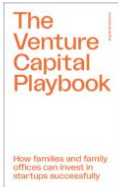
The Venture Capital Playbook Ladenpreis: 22,70EUR