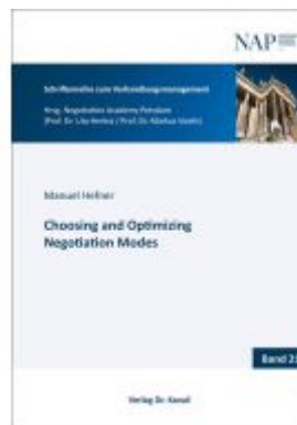
Choosing and Optimizing Negotiation Modes Ladenpreis: 79,00EUR