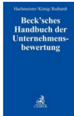
Beck'sches Handbuch der Unternehmensbewertung Ladenpreis: 153,20EUR