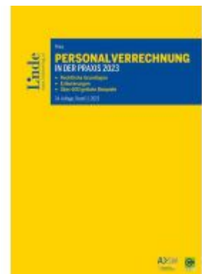
Personalverrechnung in der Praxis 2023 Ladenpreis: 116,00EUR