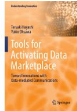
Tools for Activating Data Marketplace Ladenpreis: 164,99EUR