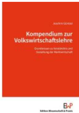
Kompendium zur Volkswirtschaftslehre. Ladenpreis: 82,20EUR

Wir haben andere Produkte gefunden, die Ihnen gefallen könnten!