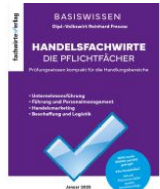
Handelsfachwirte - Die Zusammenfassung Ladenpreis: 28,80EUR