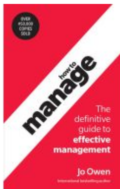
How to Manage Ladenpreis: 21,39EUR