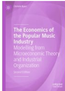
The Economics of the Popular Music Industry Ladenpreis: 142,99EUR