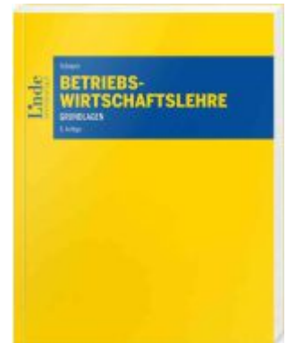
Betriebswirtschaftslehre Ladenpreis: 38,00EUR