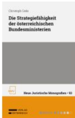
Die Strategiefähigkeit der österreichischen Bundesministerien Ladenpreis: 78,00EUR