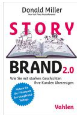
StoryBrand 2.0 Ladenpreis: 23,60EUR