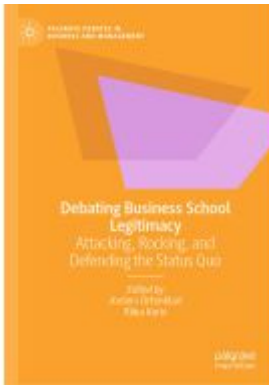
Debating Business School Legitimacy Ladenpreis: 186,99EUR