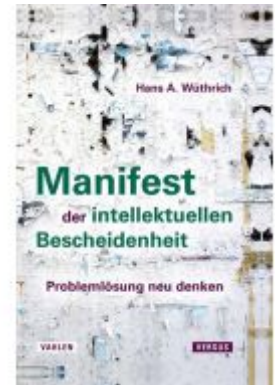
Manifest der intellektuellen Bescheidenheit Ladenpreis: 25,60EUR