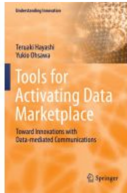
Tools for Activating Data Marketplace Ladenpreis: 164,99EUR