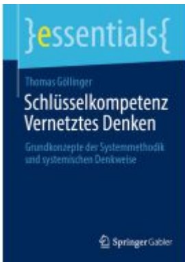
Schlüsselkompetenz Vernetztes Denken Ladenpreis: 15,41EUR