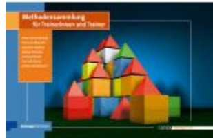
Methodensammlung für Trainerinnen und Trainer Ladenpreis: 51,30EUR