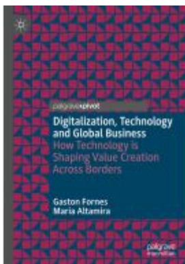
Digitalization, Technology and Global Business