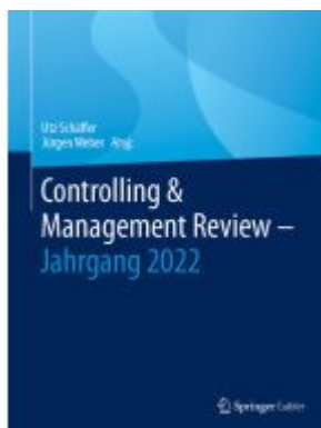
Controlling & Management Review – Jahrgang 2022