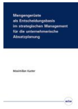
Mengengerüste als Entscheidungsbasis im strategischen Management für die unternehmerische Absatzplanung Ladenpreis: 30,80EUR