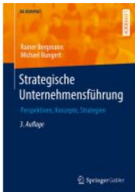
Strategische Unternehmensführung Ladenpreis: 61,68EUR

Wir haben andere Produkte gefunden, die Ihnen gefallen könnten!