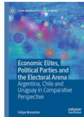
Economic Elites, Political Parties and the Electoral Arena Ladenpreis: 142,99EUR