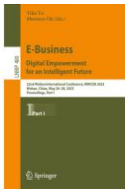
E-Business. Digital Empowerment for an Intelligent Future