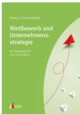
Wettbewerb und Unternehmensstrategie Ladenpreis: 30,80EUR