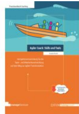
Agiler Coach: Skills und Tools Ladenpreis: 51,30EUR