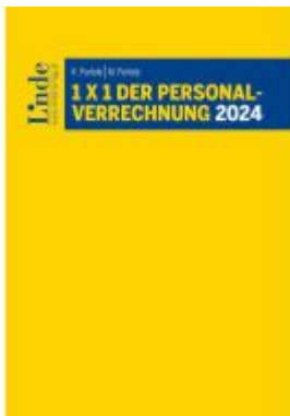
1 x 1 der Personalverrechnung 2024 Ladenpreis: 41,00EUR

Wir haben andere Produkte gefunden, die Ihnen gefallen könnten!