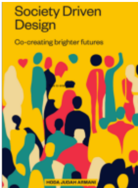
Society Driven Design Ladenpreis: 23,99EUR