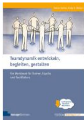
Teamdynamik entwickeln, begleiten, gestalten Ladenpreis: 51,30EUR