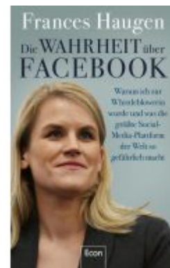
Die Wahrheit über Facebook Ladenpreis: 26,80EUR