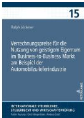
Verrechnungspreise für die Nutzung von geistigem Eigentum im Business-to-Business Markt am Beispiel der Automobilzulieferindustrie Ladenpreis: 71,90EUR