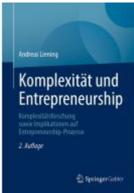
Komplexität und Entrepreneurship Ladenpreis: 92,51EUR