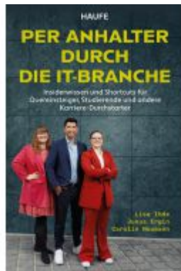
Per Anhalter durch die IT-Branche Ladenpreis: 20,60EUR

Wir haben andere Produkte gefunden, die Ihnen gefallen könnten!