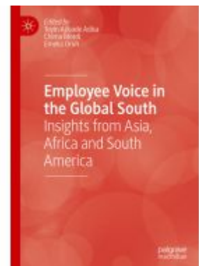
Employee Voice in the Global South Ladenpreis: 186,99EUR