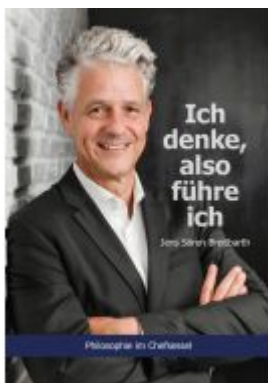
Ich denke, also führe ich Ladenpreis: 25,70EUR