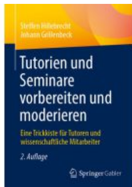
Tutorien und Seminare vorbereiten und moderieren Ladenpreis: 33,92EUR