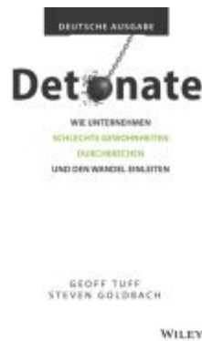
Detonate - deutsche Ausgabe Ladenpreis: 27,80EUR