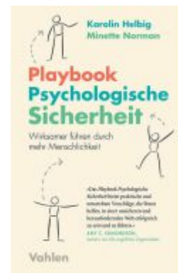
Playbook Psychologische Sicherheit Ladenpreis: 22,60EUR