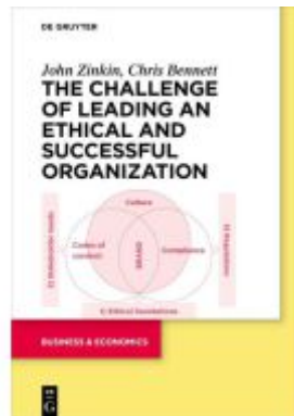
The Challenge of Leading an Ethical and Successful Organization Ladenpreis: 39,95EUR