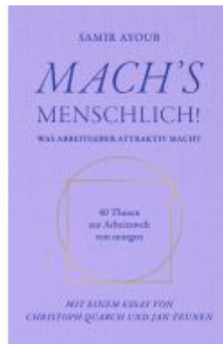
MACH'S MENSCHLICH! Ladenpreis: 20,00EUR