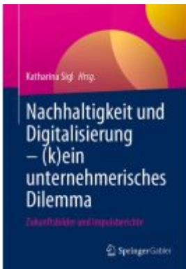
Nachhaltigkeit und Digitalisierung – (k)ein unternehmerisches Dilemma Ladenpreis: 51,39EUR