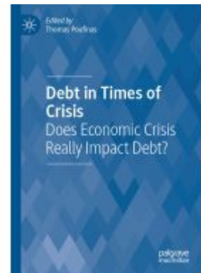
Debt in Times of Crisis Ladenpreis: 175,99EUR