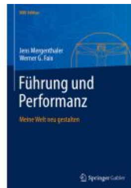
Führung und Performanz Ladenpreis: 61,68EUR