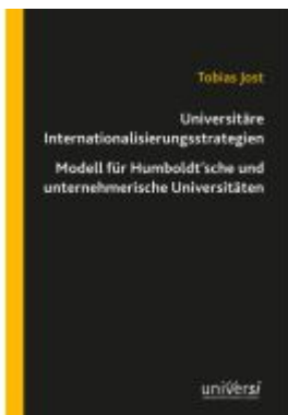
Universitäre Internationalisierungsstrategien – Modell für Humboldt'sche und unternehmerische Universitäten Ladenpreis: 19,00EUR