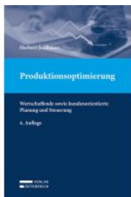
Produktionsoptimierung Ladenpreis: 68,00EUR