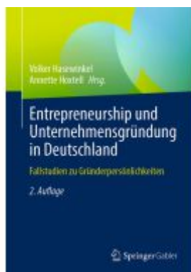
Entrepreneurship und Unternehmensgründung in Deutschland Ladenpreis: 41,11EUR