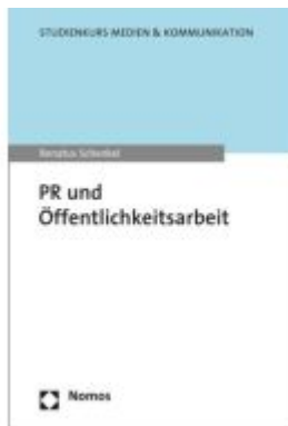
PR und Öffentlichkeitsarbeit Ladenpreis: 22,70EUR