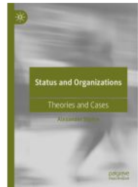
Status and Organizations Ladenpreis: 109,99EUR