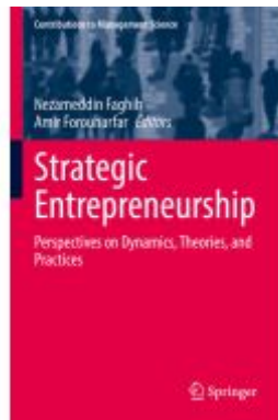
Strategic Entrepreneurship Ladenpreis: 186,99EUR