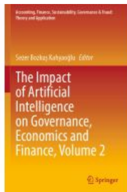
The Impact of Artificial Intelligence on Governance, Economics and Finance, Volume 2 Ladenpreis: 186,99EUR