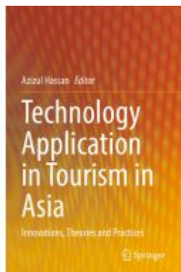
Technology Application in Tourism in Asia Ladenpreis: 197,99EUR