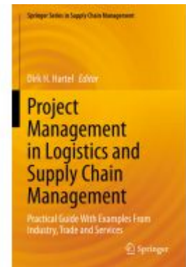
Project Management in Logistics and Supply Chain Management Ladenpreis: 71,49EUR