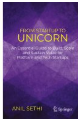
From Startup to Unicorn Ladenpreis: 36,29EUR