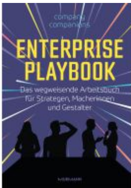
Enterprise Playbook Ladenpreis: 40,10EUR

Wir haben andere Produkte gefunden, die Ihnen gefallen könnten!