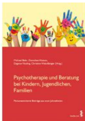
Psychotherapie und Beratung bei Kindern, Jugendlichen, Familien Ladenpreis: 29,90 EUR