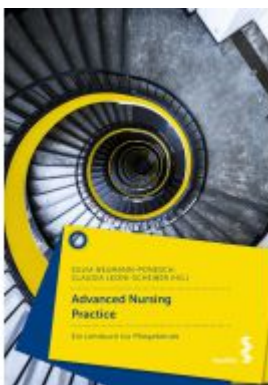
Advanced Nursing Practice Ladenpreis: 24,90 EUR