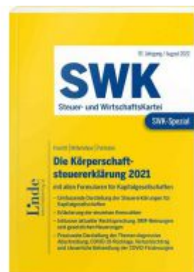
SWK-Spezial Die Körperschaftsteuererklärung 2021 Ladenpreis: 48,00 EUR