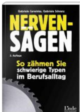
Nervensagen Ladenpreis: 22,00 EUR