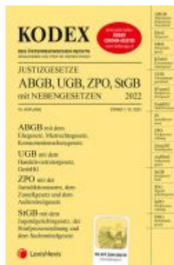
KODEX Justizgesetze 2022 - inkl. App Ladenpreis: 29,00 EUR