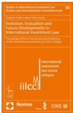
Evolution, Evaluation and Future Developments in International Investment Law

Wir haben andere Produkte gefunden, die Ihnen gefallen könnten!