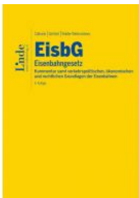
EisbG | Eisenbahngesetz Ladenpreis: 168,00 EUR