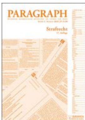
Paragraph - Strafrecht Ladenpreis: 15,90 EUR